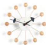
Ball Clock, hêtre, Ø 330