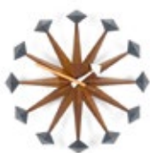
Polygon Clock, noyer, Ø 430