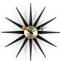
Sunburst Clock, noir/laiton, Ø 470