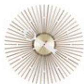
Popsicle Clock, Nussbaum, Ø 350