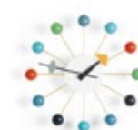
Ball Clock, multicolore, Ø 330