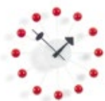
Ball Clock, rouge, Ø 330