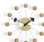
Ball Clock, cerisier, Ø 330