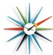
Sunburst Clock, multicolore, Ø 470