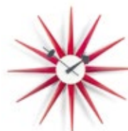
Sunburst Clock, rouge, Ø 470