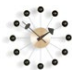
Ball Clock, noir/laiton, Ø 330