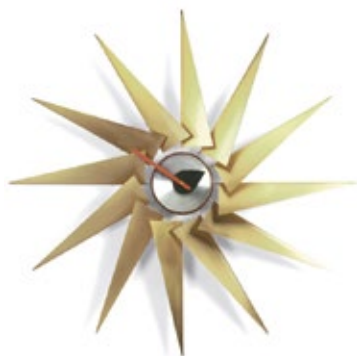
Turbine Clock, laiton/aluminium, Ø 765