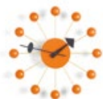
Ball Clock, orange, Ø 330