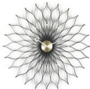
Sunflower Clock, frêne noir/laiton, Ø 750