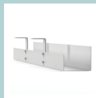
Chemins de câbles