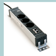
Blocs prise électrique