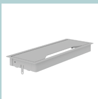
Passe-câble de bureau en métal: 317x119 mm, H=27 mm